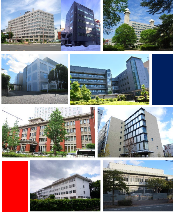
FAMIC本部 & 各地域センター