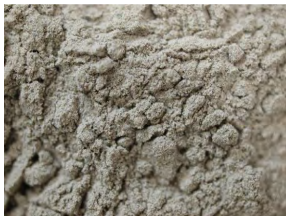
▲ 熔成ほう素肥料(1), 実体顕微鏡(10倍)