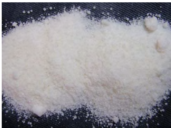
▲ ほう酸塩肥料(1), 現物