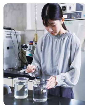
ミジンコの水替え作業

食の安全に貢献できる仕事であり、やりがいを感じています。また、先輩に相談しやすく、良い環境で仕事ができていると感じます。