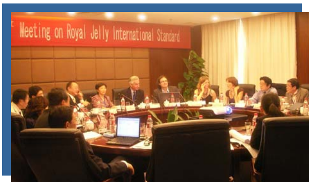
第1回専門家会合(2009. 10. 中国南京)