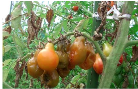
ミニトマト(軟腐病)