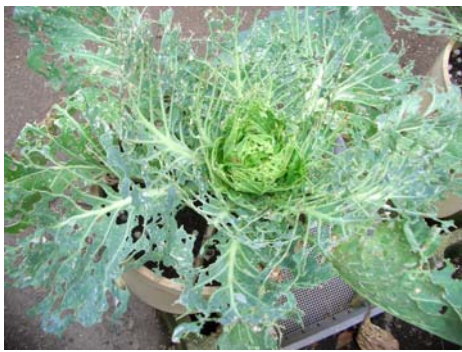
キャベツ(あおむしの食害)