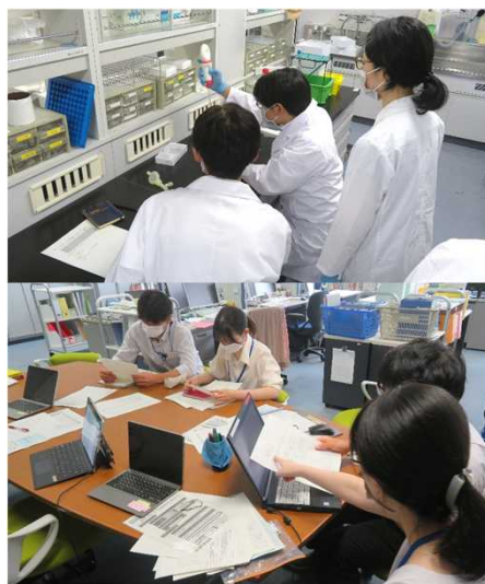
インターンシップの様子