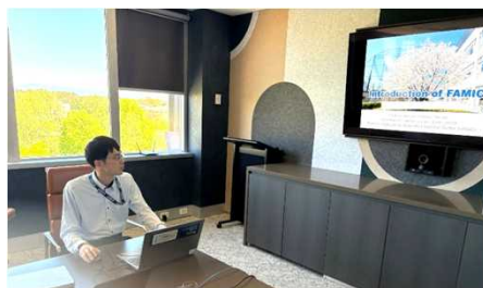
APVMA現地研修でのプレゼンの様子

（APVMA：オーストラリア農薬・動物用医薬品局。オーストラリアにおける、FAMIC農薬検査部との同等機関。）