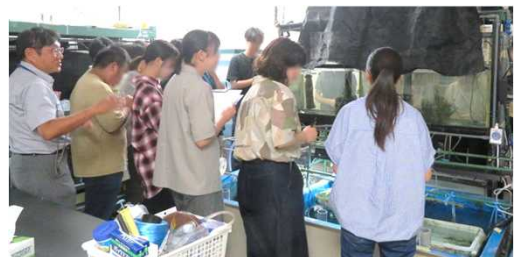
実験室の見学の様子(大学の講義の一環)

https://www.famic.go.jp/recruitment_internship/