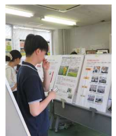
展示室の見学の様子