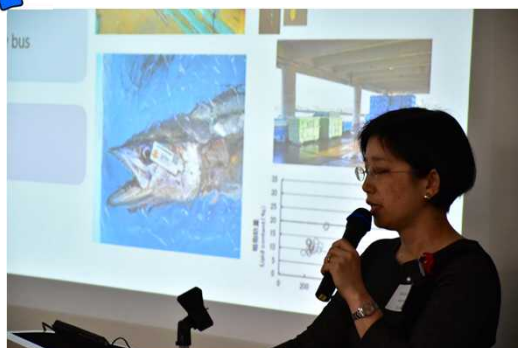
K値について、国際会議の場で説明する専門家