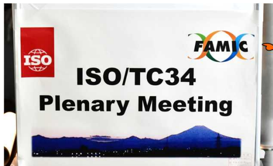
FAMICがホスト役を務めた会議の案内掲示

日本からも、我が国で開発された規格を国際取引に活用してもらえるよう、ISOに提案しています。その中の1つに、魚の鮮度を測定する方法があります。魚の鮮度にこだわる日本ならではの提案ですね。次のページでもう少し詳しく説明します!